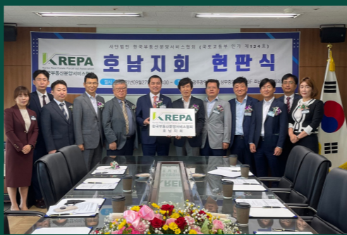
2021.09.27 호남지회 현판식