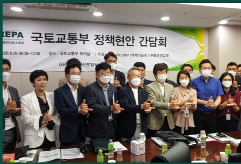
2020.06.25 국토교통부 정책현안 간담회