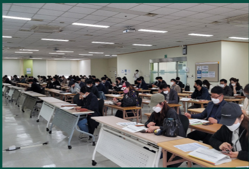
2021.04.06 제1차 분양대행자 법정교육 실시