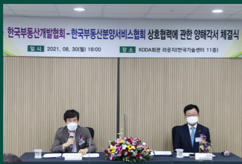
2021.08.30 한국부동산개발협회 MOU