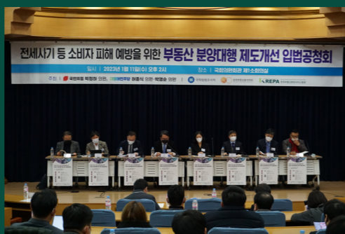
2023.01.11 부동산 분양대행 제도개선 입법공청회