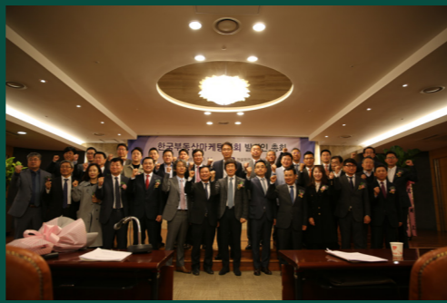
2018.10.16 협회 발기인 총회